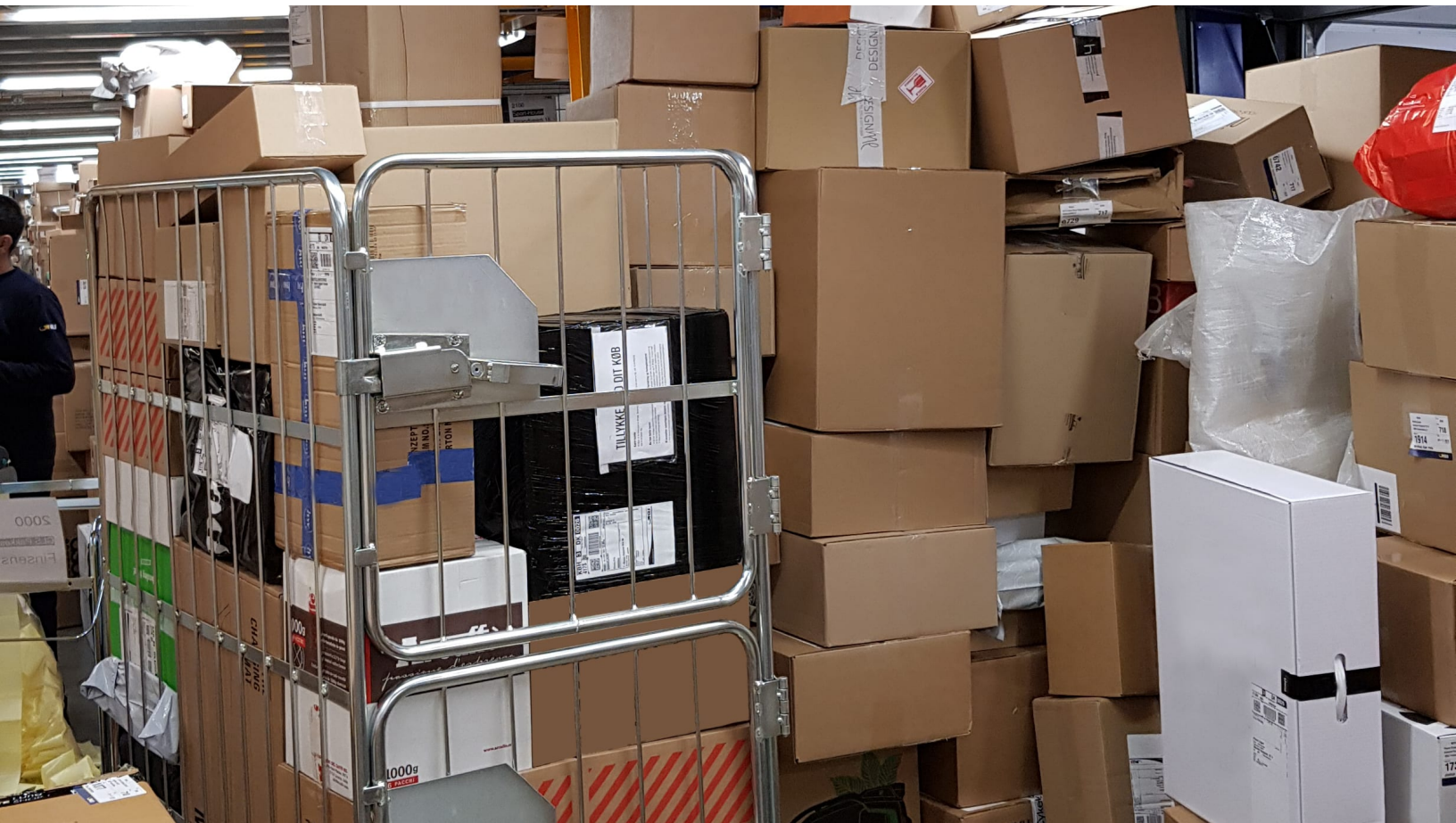
GLS PakkeShops bugner af pakker