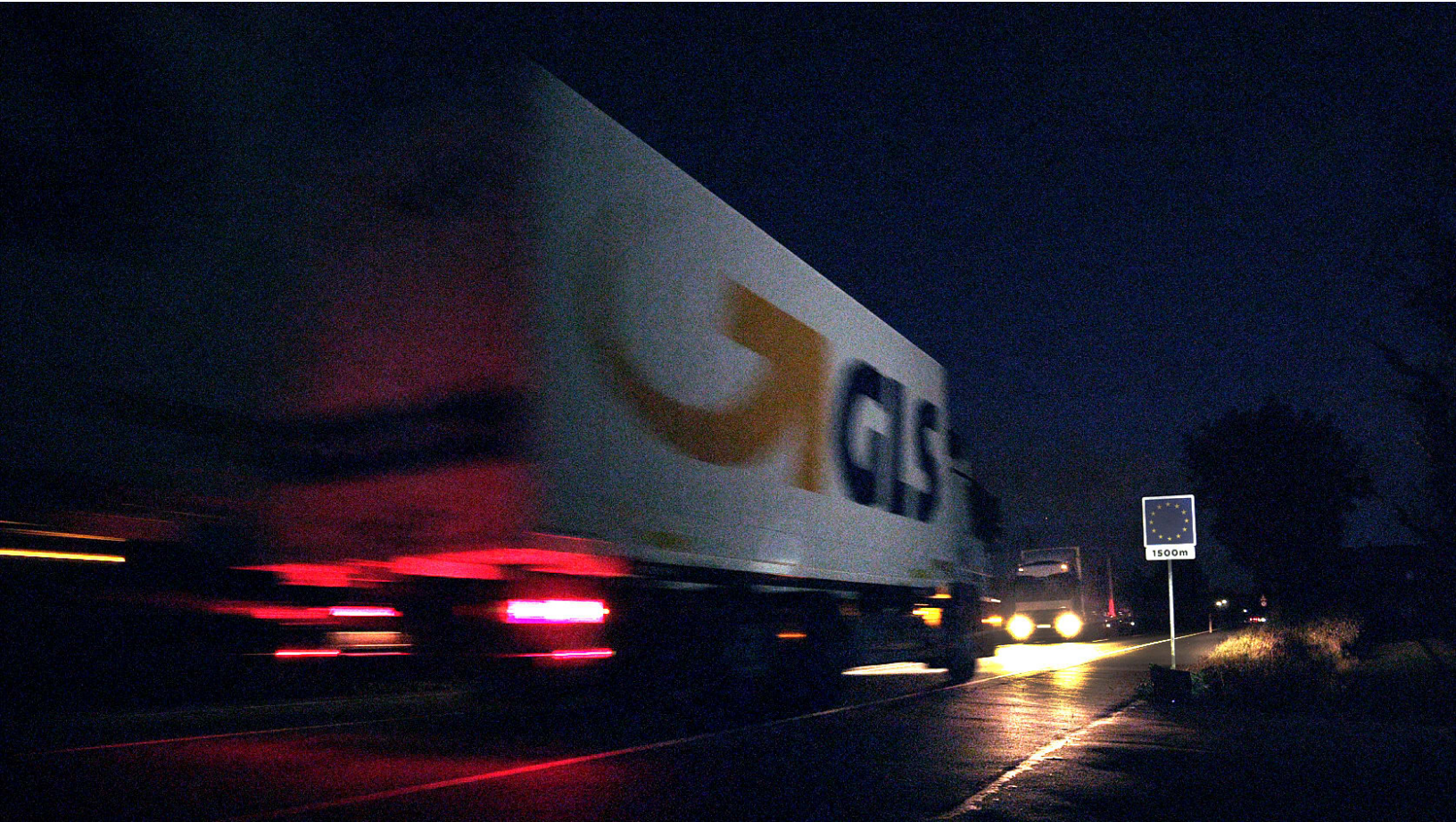
GLS linehaul på vej til grænsen