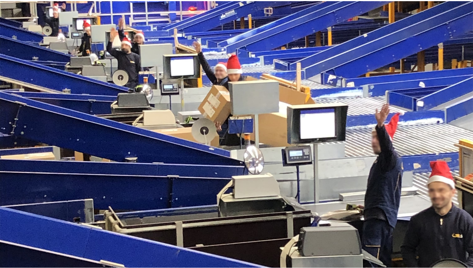
Sorteringspersonale i julehumør ved GLS.